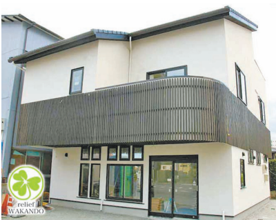
自然素材を多用した新店舗の外観