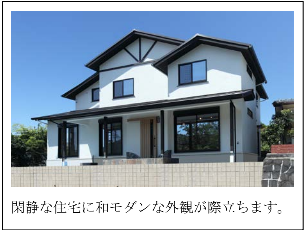
閑静な住宅に和モダンな外観が際立ちます。

お母様 落ち着いた雰囲気でもっともゆったりした感じで満足です。特に洗い出しの内土間が気に入ってます。